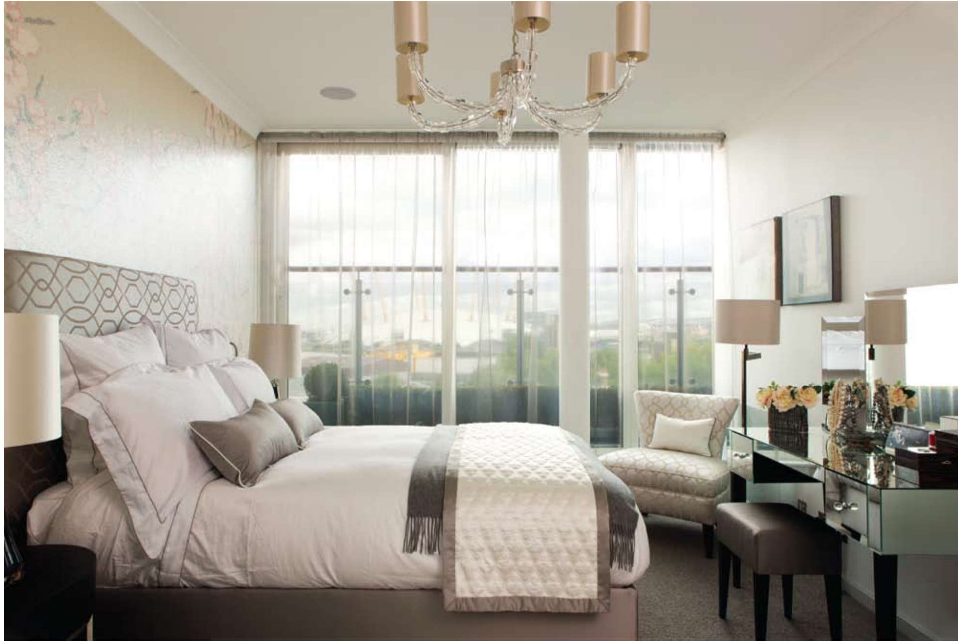
Her 3 yatak odasında dairenin genelindeki bütünlüğü bozulmamış ve burada da natürel tonlar kullanılmış. İpek ve kadifenin bir arada kullanılmasıyla konforlu olduğu kadar şık bir görünüm elde edilmiş. Kullanılan aksesuarlar ve tablolarla sakin ve dengeli bir bütünlük elde edilmiş.