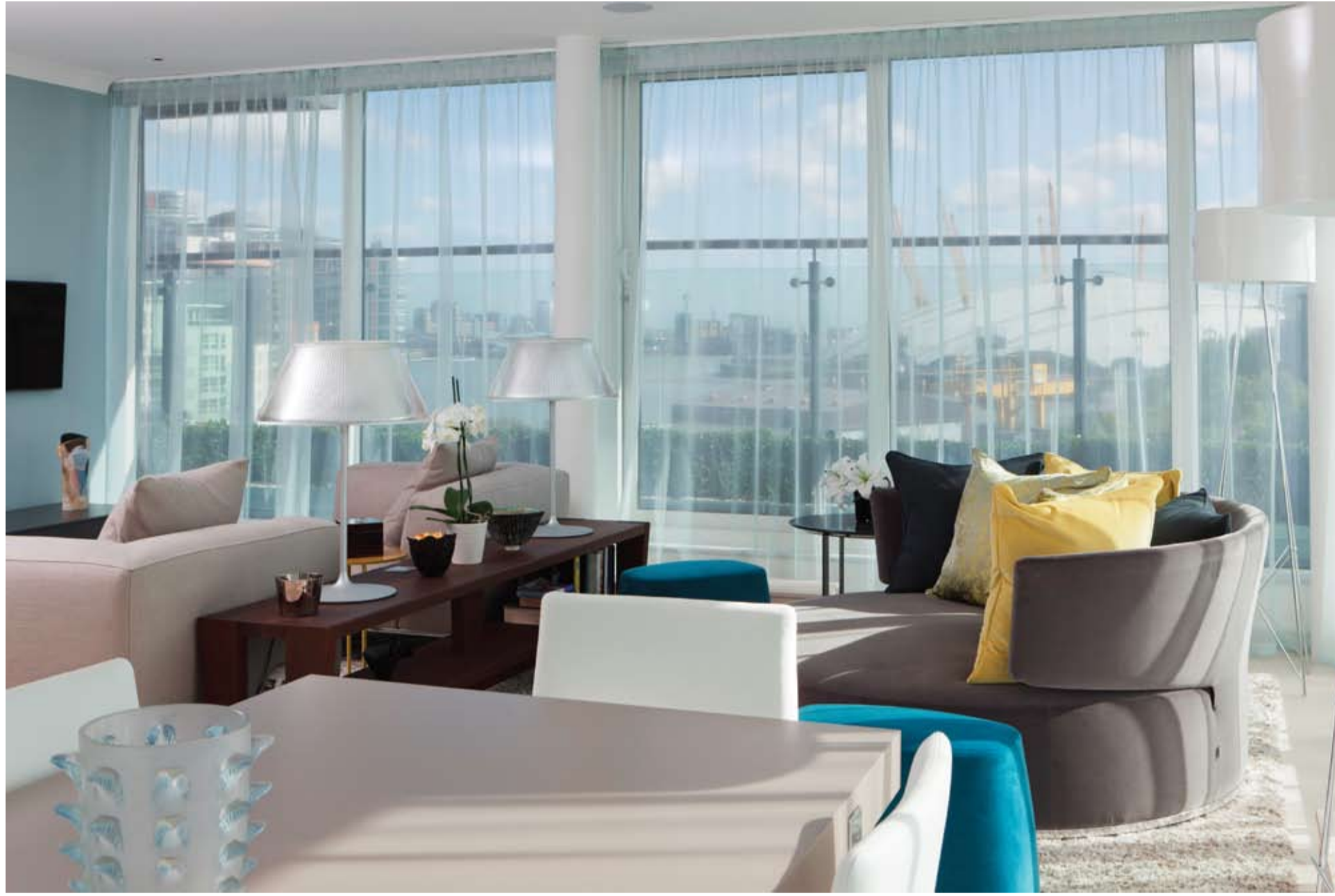
Mutfak ve oturma odası arasındaki duvarın kaldırılmasıyla ferah bir yaşam alanı elde edilmiş. İç mekan tasarımı çağımız metropol yaşamına uygun bir şekilde düzenlenmiş. Duvarlarda beyaz kullanılırken, koltuk ve kanepelerin döşemelerinde ağırlıklı olarak uçuk gri tercih edilmiş. Kullanılan tüm mobilya ve aydınlatmalar İtalyan ve İspanyol.