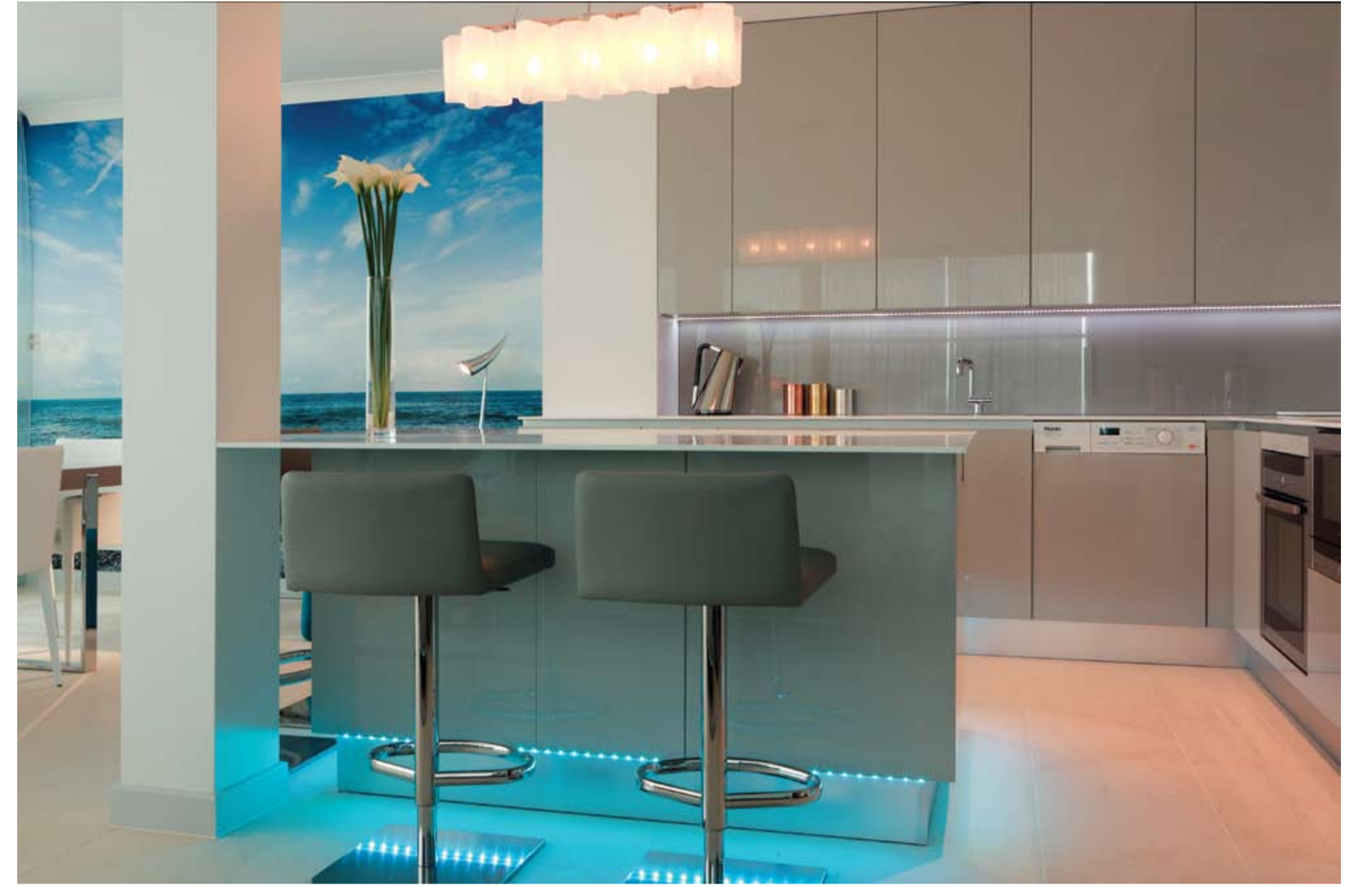
Minimalist tarzdaki İtalyan mutfak, çağdaş bir ifade taşıyor. Ortadaki sütuna dayanmış 15 mm kalınlığında Corian tezgah ile küçük bir adacık oluşturulmuş. Alt kısmında kullanılan LED aydınlatmalar sayesinde, dolap ve çekmeceleriyle bu tezgaha adeta yüzüyor havası verilmiş. LED aydınlatmalar istenildiğinde farklı renklerde kullanılabilir.