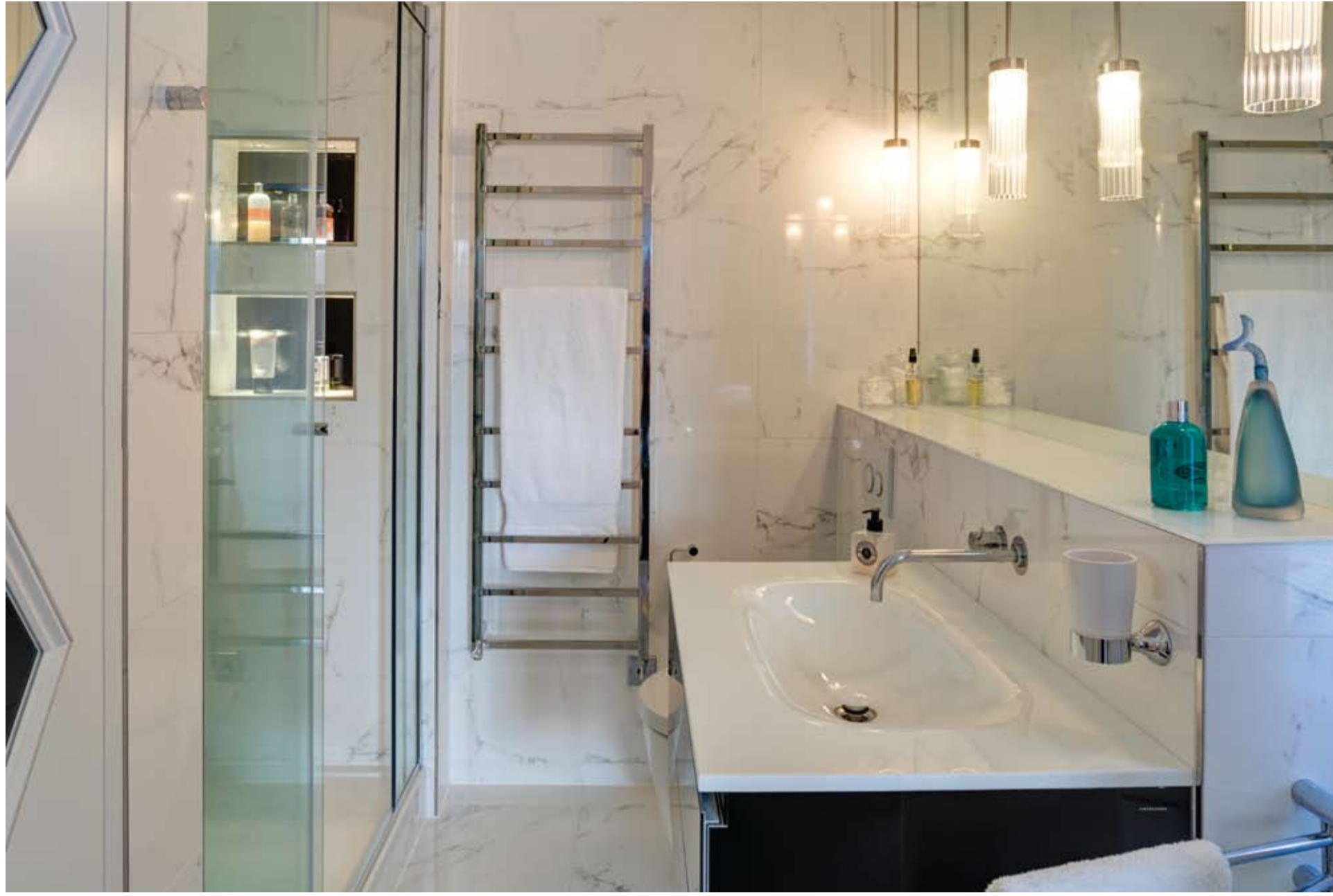
Gerek ana yatak odası gerekse konuk yatak odasındaki banyolarda da siyah ve beyazın dengeli uyumu sürdürülmüş. 1m2'lik karolar halinde döşenen mermer efektli fayanslarla duvarlar ve zemin kaplanırken, siyah renkli Porcelanosa Italian tuvalet masası ve Artlinea lavabo şık bir görünüm yaratmış.