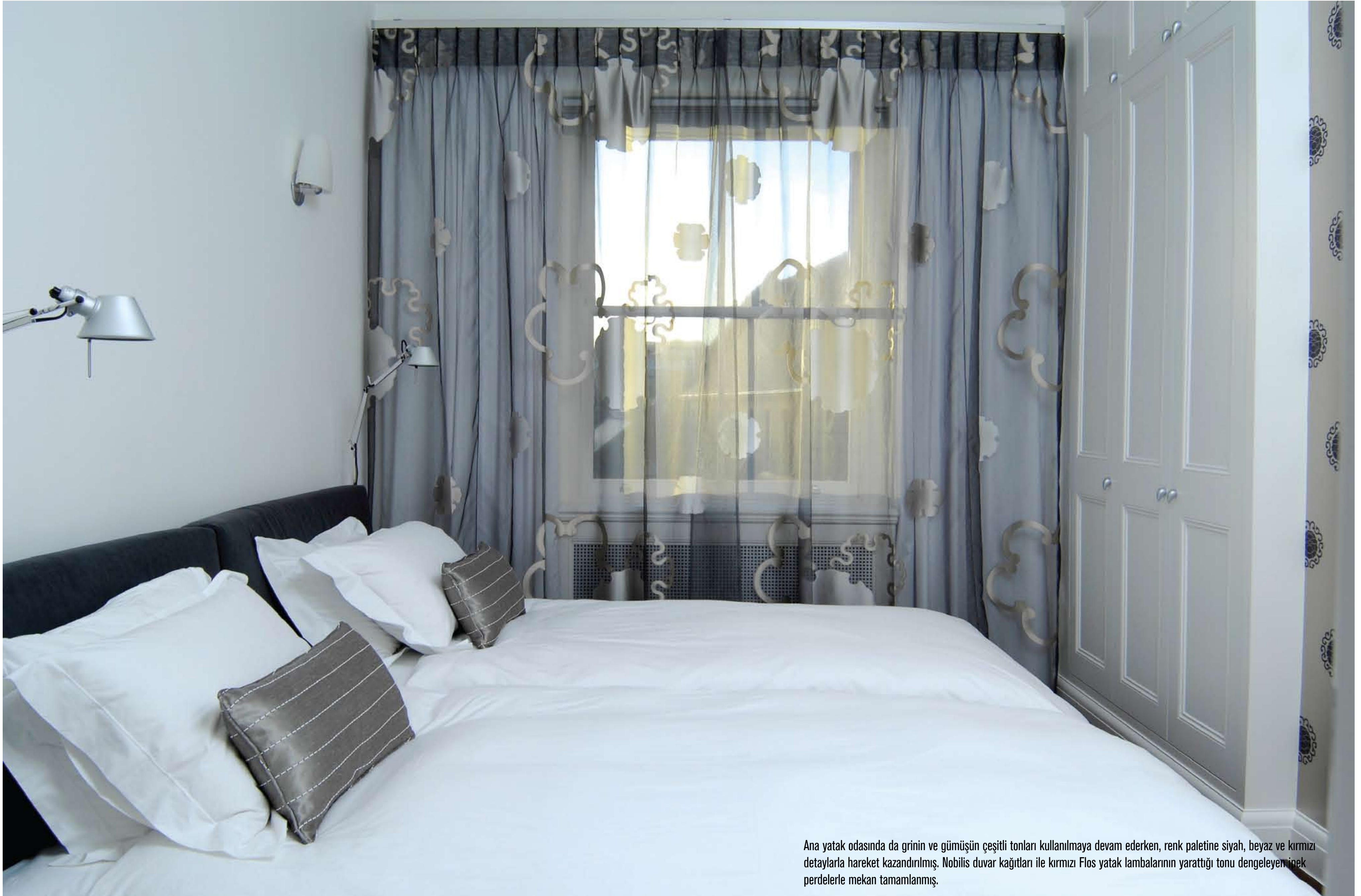
Ana yatak odasında da grinin ve gümüşün çeşitli tonları kullanılmaya devam ederken, renk paletine siyah, beyaz ve kırmızı detaylarla hareket kazandırılmış. Nobilis duvar kağıtları ile kırmızı Flos yatak lambalarının yarattığı tonu dengeleyen ipek perdelerle mekan tamamlanmış.